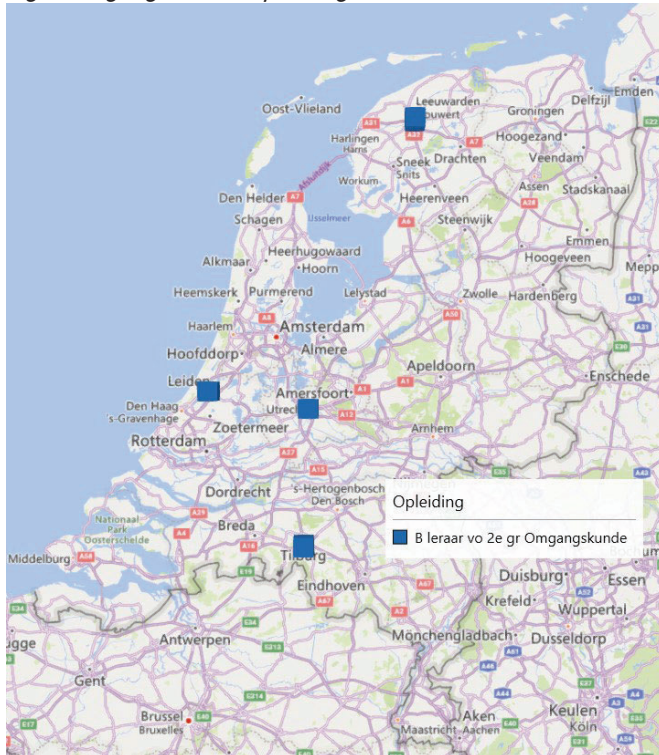
Figuur 2. geografische spreiding binnen Nederland