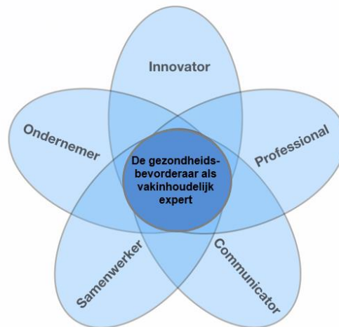
Figuur 2 Rollen bachelor Gezondheid

voortkomende kernhandelingen zijn terug te vinden in externe bijlage 1.